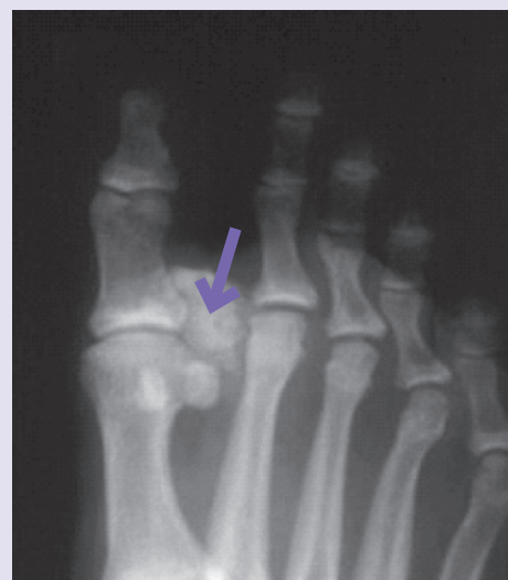
Zunajkostne kalcifikacije ob sklepu stopalnih kosti

Bolezen dokažemo z določitvijo koncentracije fosfatov, kalcija, alkalne fosfataze, parathormona in vitamina D v krvi. Opravimo rentgensko slikanje okostja (paratiroidno serijo), pri čemer se moramo zavedati, da je potrebno vsaj 40% zmanjšanje vsebnosti kalcija v kosteh, da se na rentgenski sliki vidijo spremembe. Dinamiko sprememb v kostni gostoti nam dobro prikazuje tudi merjenje kostne gostote. Zlati standard za postavitve diagnoze pa je kostna biopsija.